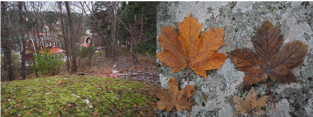
Figur 2 Löv från skogslönn till vänster och sykomorlönn till höger

Sykomorlönn är inte naturligt i Sverige. Men har ett fint virke och växer fort så den har introducerats. Jag hittade massor av sykomorlönn på Lidingö.