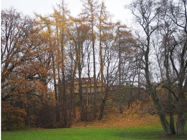
Figur 1 Lärk vid Hersbyholm. Skärmen syns vid träden - alarna- till höger i bilden

SVAR:FEL! Lärk är ett barrträd! – enkelt för er