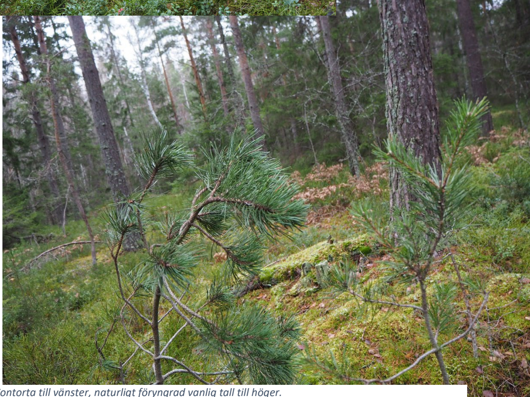
Contorta till vänster, naturligt förnygrad vanlig tall till höger.