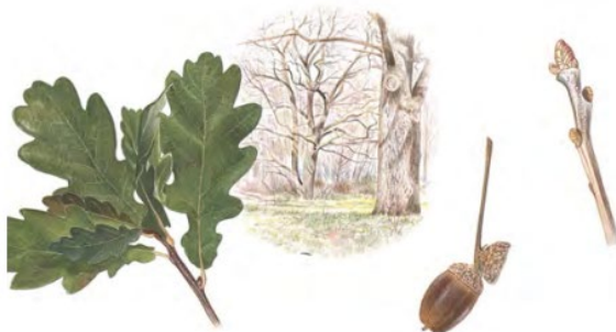
Skogsekens blad har 3-6 par småflikar). Ollonen är oskaftade men sitter på en lång fruktställning som ser ut som en stjälek (därifrån namnet stjälkek). Illustration från Bo Mossberg, Den nordiska floran.