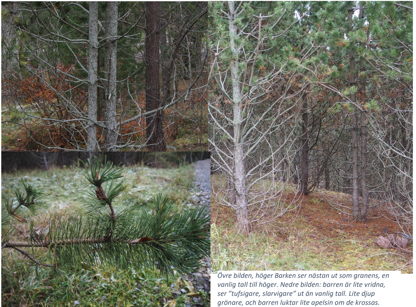
Övre bilden, höger Barken ser nästan ut som granens, en vanlig tall till höger. Nedre bilden: barren är lite vridna, ser "tufsigare, slarvigare" ut än vanlig tall. Lite djup grönnare, och barren luktar lite apelsin om de krossas.

Så jag for ut och i skydd av natten sågade jag ner en liten contorta- nästan hemma hos Björn Wiberg☺, fick in den i bilen, bar ut den i skogen, spetsade stammen och fick ner den en bra bit